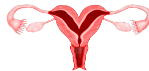
Gambar ( Times New Roman 12)